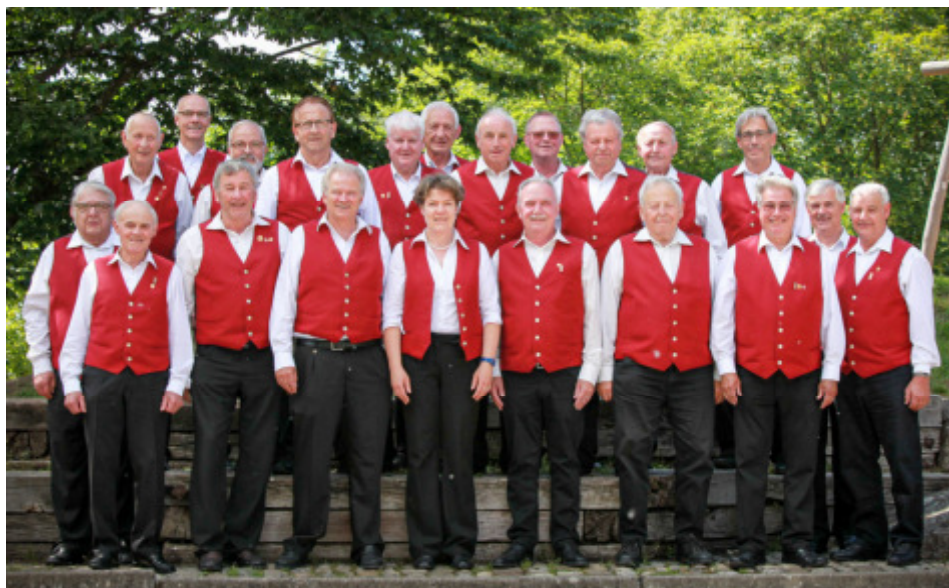
Bild: Der Männerchor gegen Ende eines schönen und geselligen Sängertages in Münsingen 2019

Am 13. Juni 2015 nahm der Männerchor Schlosswil zum ersten Mal in der Vereinsgeschichte an einem Schweizerischen Gesangsfest teil. Zusammen mit dem Männerchor Rüfenacht-Allmendingen sang der Chor zwei Lieder vor Experten („Ungarischer Tanz“ und „La Provence“). Der Expertenbericht fiel für die beiden Chöre sehr positiv aus. Zum Abschluss des Tages steht im Protokollbuch: „Doch genossen wir am späteren Nachmittag das gemütliche Beisammensein in der Sängergasse. Die Schlussfeier am Abend war sehr eindrücklich. So traten wir mit vielen schönen und eindrücklichen Erinnerungen den Heimweg an“.