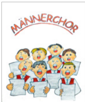
Zeichnung von Vreni Schalbetter, Mitglied der Theatergruppe

Die Hoffnung nicht aufgeben und für die Existenz des Chors weiterkämpfen!